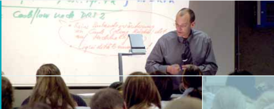
Vorlesung an Präsenztagen