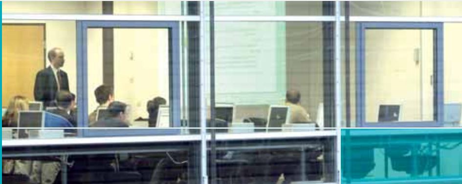
Studierende im Computer-Pool