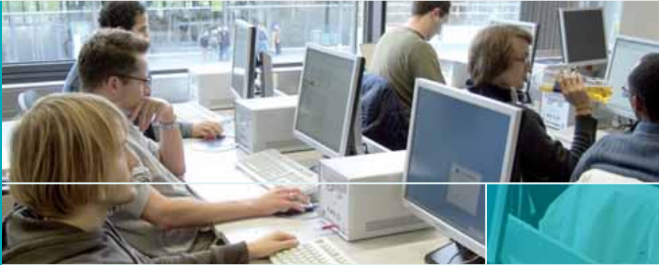
Studierende im Computer-Pool